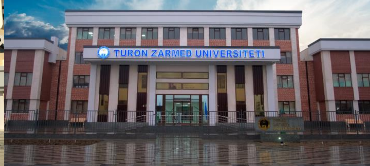
Университет Турон Зармед, г. Самарканд, г. Бухара