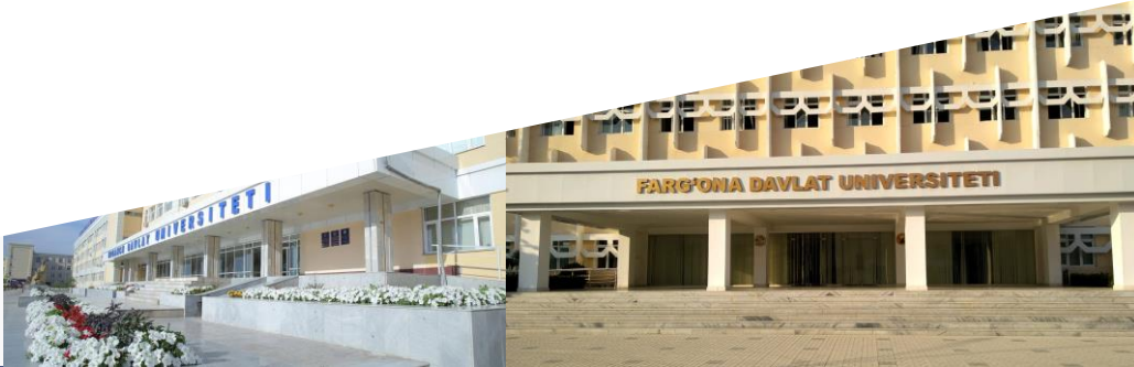
Ферганский государственный университет