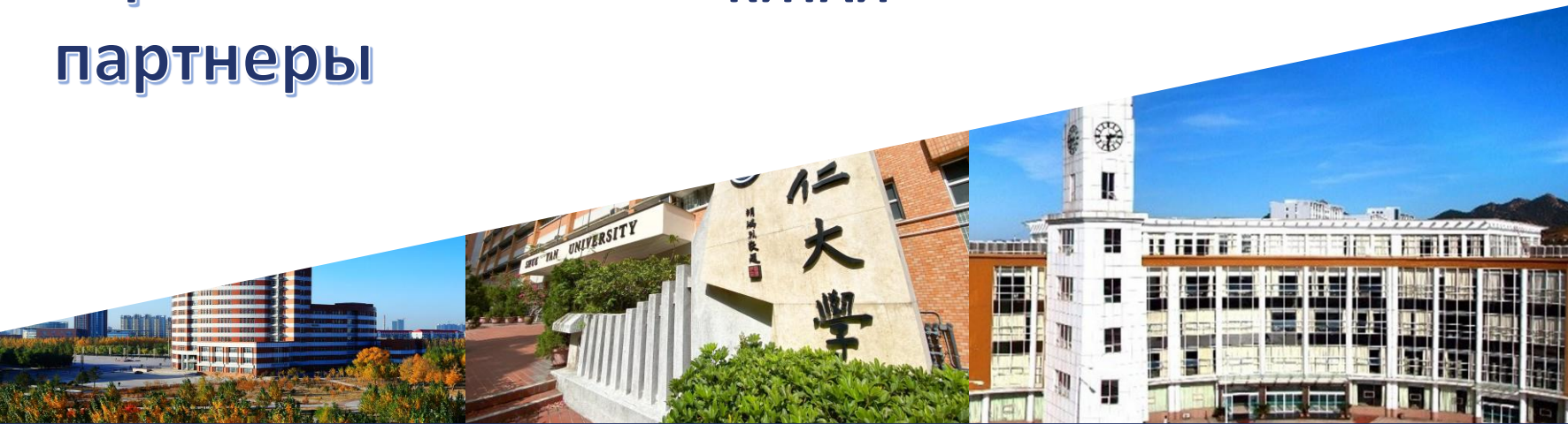
Университет Сюнь, Гонконг