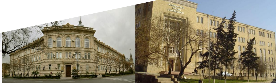
Азербайджанский государственный экономический университет