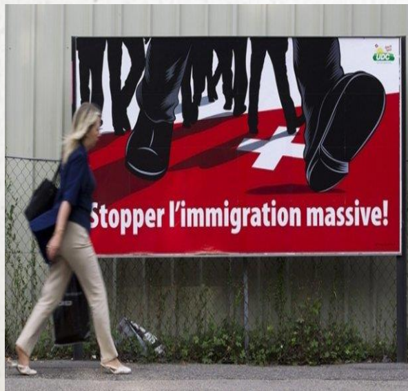
Мигранты и безработица в Швейцарии