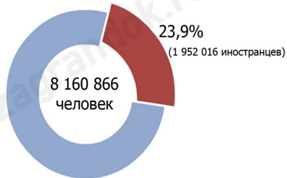
Население Швейцарии в 2014 году По данным Федерального статистического ведомства (конец 1 квартала)

( Федеральный закон от 1931 года, который действует до сих пор, Закон о беженцах)