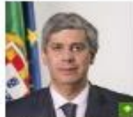
Mário Centeno Ministro das Finanças Período de governação: 2015-10-26 até à data atual Secretários de Estado (5)