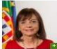
Maria Manuel Leitão Marques Ministra da Presidência e da Modernização Administrativa Período de governação: 2015-10-26 até à data atual Secretários de Estado (3)