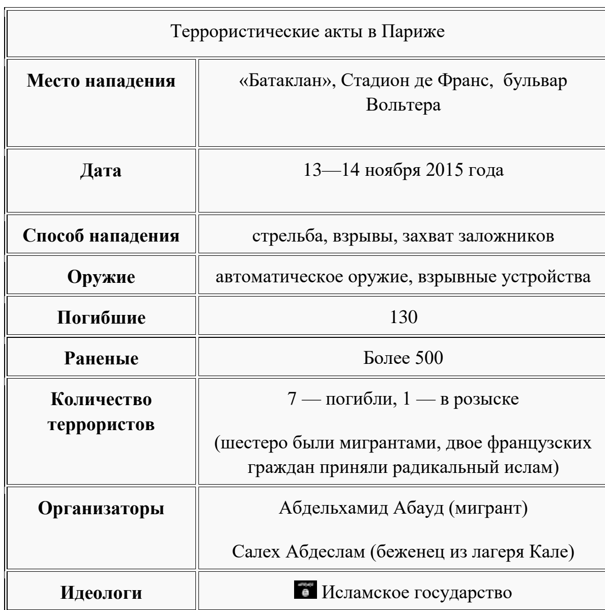
Рис. 3. Сводные данные ивент – анализа террористических актов в Париже, 13 – 14 ноября 2015 г.

Эти теракты стали крупнейшими по числу жертв за всю историю Франции и самым масштабным по числу жертв нападением на Париж со времён Второй мировой войны (130 погибших, более 500 раненных). В стране четвёртый раз за всю национальную историю было введено чрезвычайное положение.